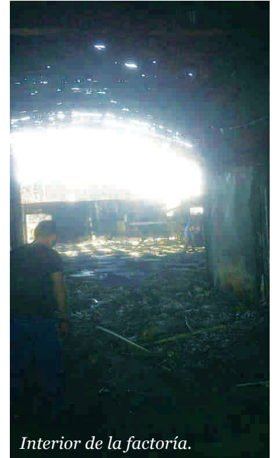
Interior de la factoría.