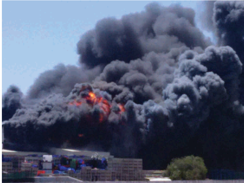
Fuego de enormes dimensiones.

inmediaciones, por RIESGO DE EXPLOSIÓN porque ardían unos depósitos de gasóil de la fábrica junto a la vivienda vecina (empresa del "Chanca" que procesa aceituna). La Guardia Civil, además, pidió a Protección Civil que diera la orden a algunos vecinos de la Urbanización de Los Claveles, los que lindan con el Chanca, de que se alejaran de sus viviendas, informan de riesgo de explosión. Finalmente los vecinos de esta Urbanización linderos con la fábrica fueron desalojados y la zona acordada.