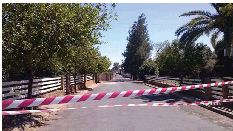
Urbanización de Los Claveles acordonada.