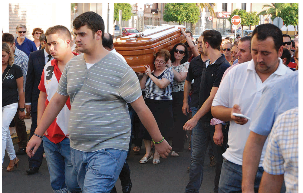
Multitud de gente acompañó al féretro hasta el Cementerio de San José.

el que fue ordenado sacerdote el 8 de Diciembre de 1983. Este año cumplía su 30 aniversario como sacerdote, más de la mitad de su vida.